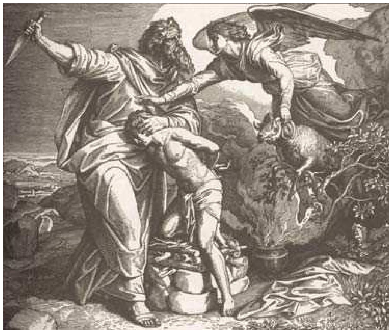
„Abraham składa w ofierze Isaaka”