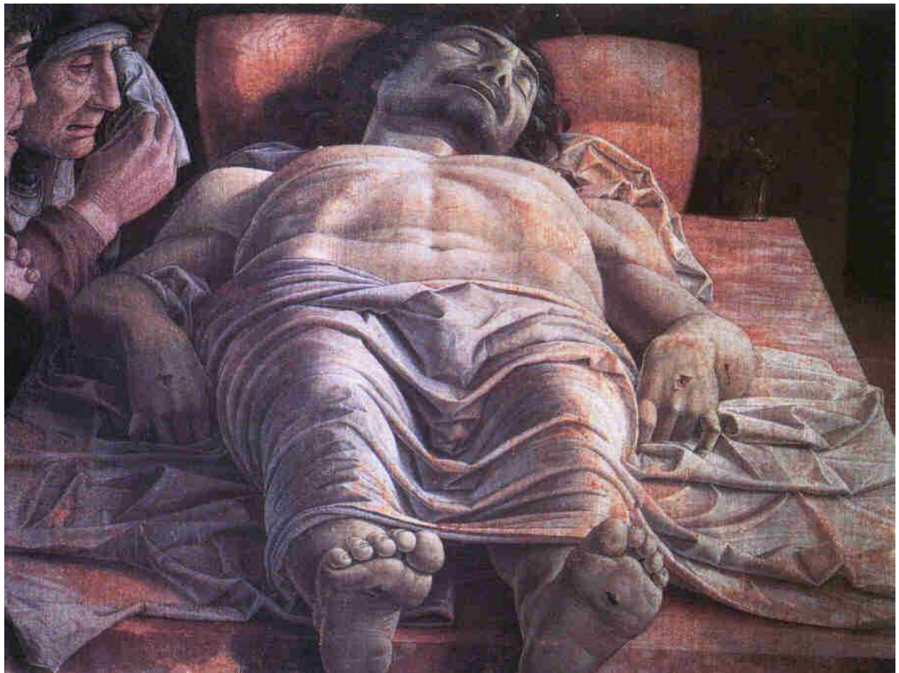
Andrea Mantegna „Opłakiwanie zmarłego Chrystusa”